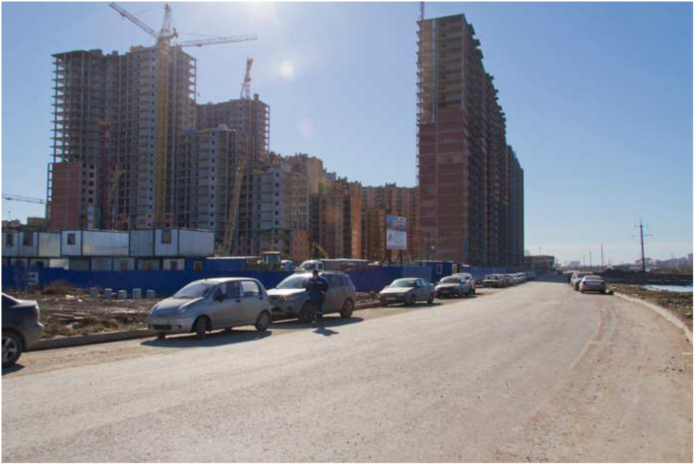
Вид со стороны Областной улицы 29-26, 31, 17-15