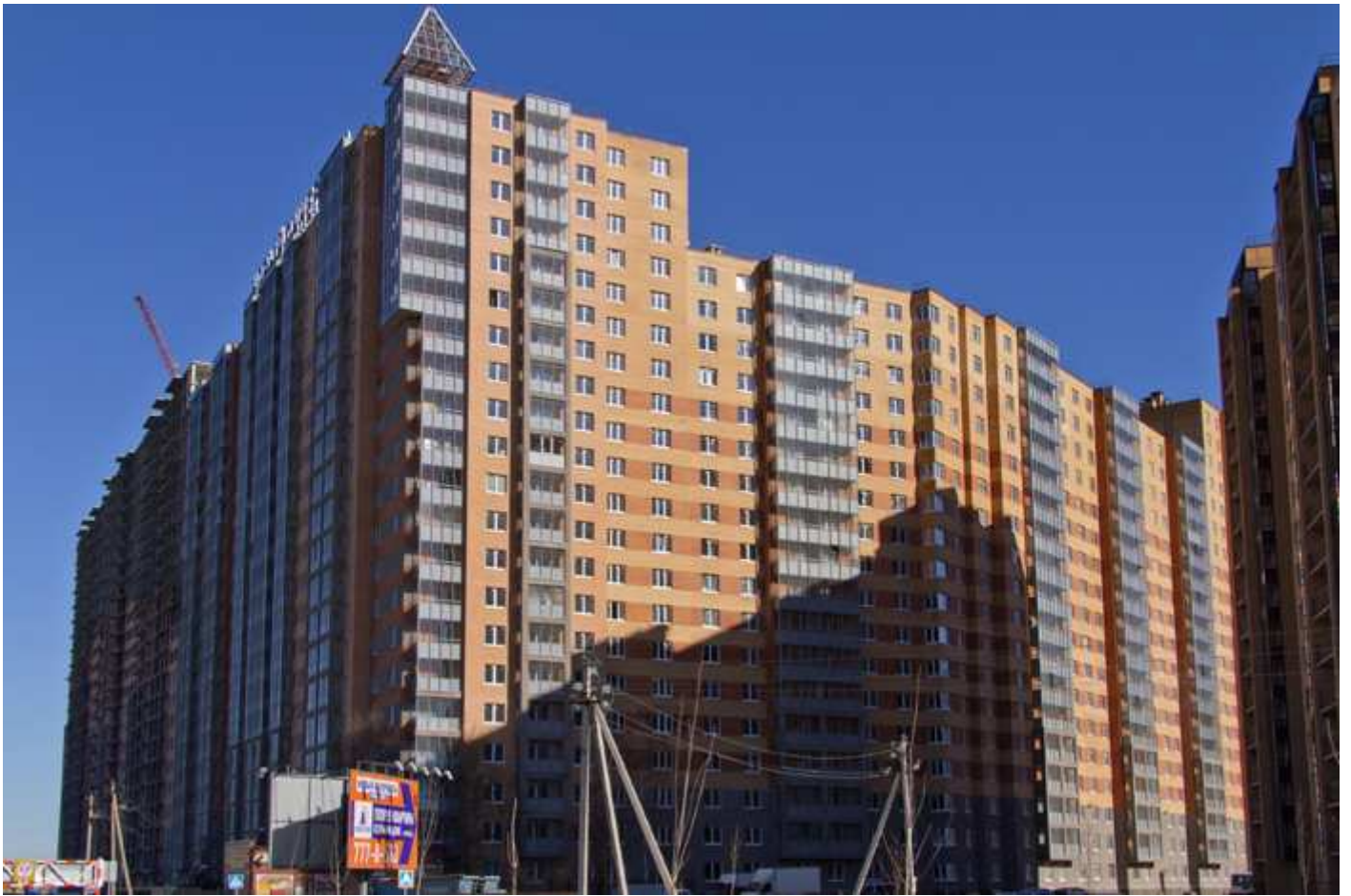
Вид с Областной улицы на секции (слева направо) 17-7